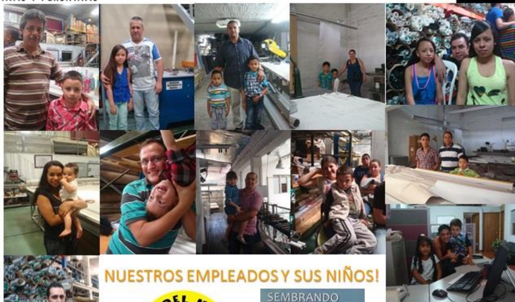
NUESTROS EMPLEADOS Y SUS NIÑOS!